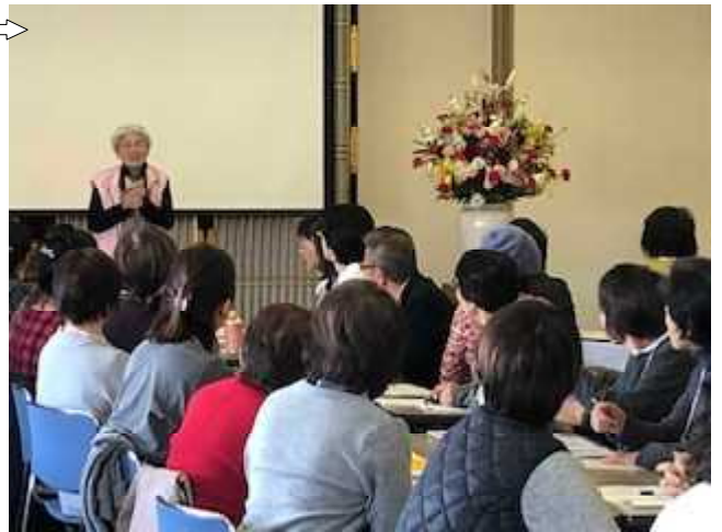
開会挨拶(高林名誉理事長)