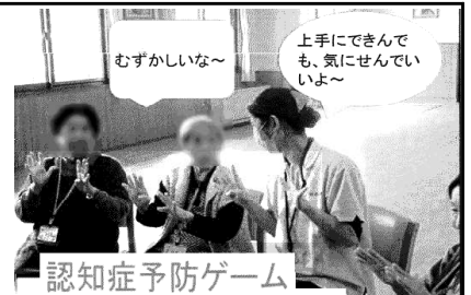
認知症予防ゲーム