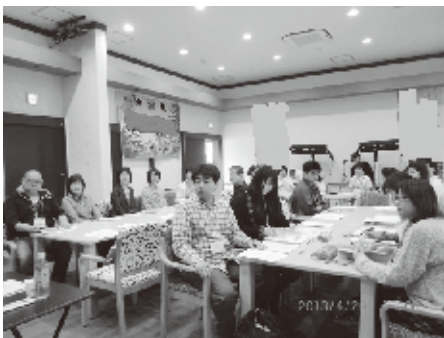
養成講座の始まりは講義

「利用者さん大変インパクトが有り、身体にも脳にも良い効果が期待できると感じています。スタッフにも刺激が有り、勉強になっている」とありました。皆さんの状況把握が不十分なので、対応が難しいのですが、回数を重ねた結果が楽しみです。