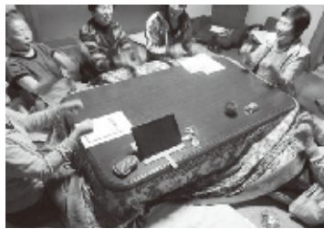
5月半ばなのに寒くて炬燵で研修会「ゲーチョコキパー」

昨年12月在宅被災者とゲームを楽しんだあと、中心になってくださったお二人から「集まりのときに手指体操だけでもやりたいが進め方が難しいので教えてほしい」との声が上がったのでした。テキストを差し上げて、次回必ず手ほどきしますと約束しました。被災した家屋を改修してボランティアのための宿として開放している「ボラ宿・若芽」で、今回は小さな研修会を開催。