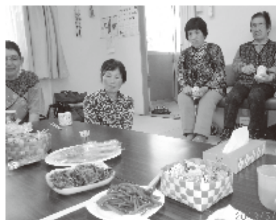
福島飯館村強制避難住宅でのおちゃっこ

福島市上野台運動公園仮設住宅で、飯館村から避難されている方々へ初めてスリーA方式ゲームでのお見舞いに参りました。強い風の吹く肌寒い一日でした。全員で13名の輪。自治会長黒一点、福島ではスリーAのスの字もご存じなくゲームでのお見舞いも型破りで初めて。何が始まるのか不安げな皆さんでした。手指ゲームでは、笑いの渦は起こらず、私が緊張していたのかと反省しながら、お隣のソフトタッチのリズム運動2拍子で大爆笑！みなさんの笑いが止まらない！3・4拍子も自然に大笑い。お手玉回しでは、4枚接ぎのお手玉が珍しいと、裁ち方の質問を受けました。どじょうさんの号令かけを順にやってみて、シート玉入れも大はしゃぎ、じゃんけんタスキとりゲームでは、一番物静かな方が優勝！