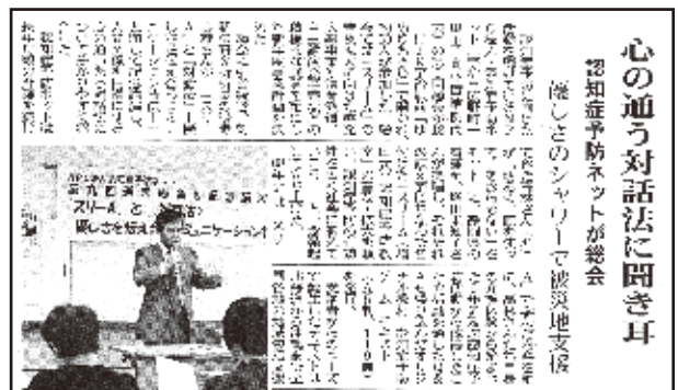
総会が新聞にも掲載されました。(5月22日 洛南タイムス)