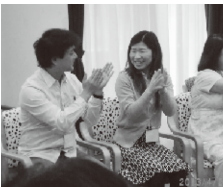
「褒め方のコツも習って、上手にできました～」