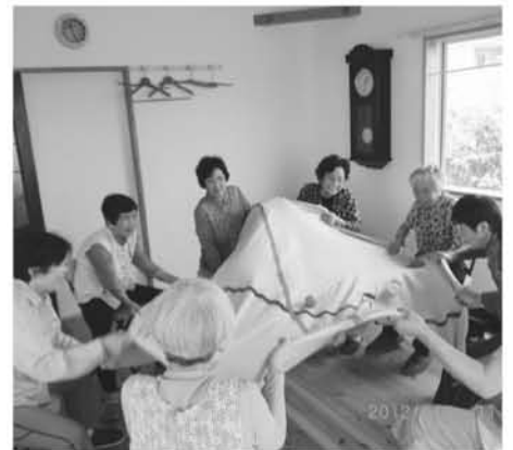
シーツ玉入れは夢中になるね