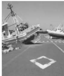
震災当日の請戸海岸

後日お二方からお便りをいただきました。「話を聴いてもらって楽になった、当仮設の70〜80歳代の一人暮らしの方の手助けをしながら過ごしたい、生きていることが幸せ、家族全員無事でしたから」仮設住宅まで応援に来ていただいた皆さんのお蔭で何とか元気に暮らしている、自宅が避難解除準備区域に指定されて出入りは出来るが、寝泊りは出来ない、大震災当日を見ていたきたい」と請戸(うけと)海岸ほかの写真が同封されていました。