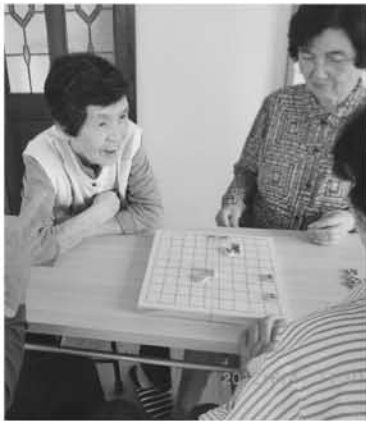
追っかけ将棋で駒が立ったよ～!