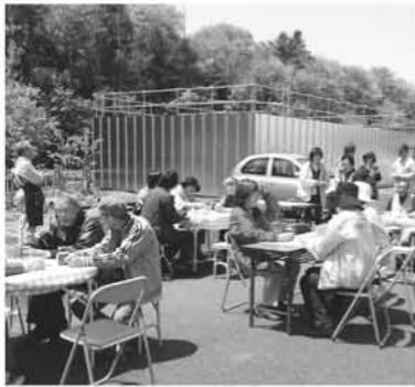
強風のためにパラソルは外された 「青空喫茶」

被災者のための仮設住宅で認知症激増とのニュースを聞き、私たちに少しでもお手伝いが出ないものかと考えていたところ、「東日本復興支援ボランティア募集」があり「これだ！」と仲間二人で参加。