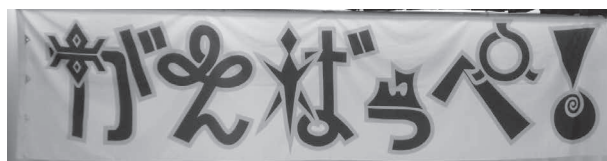
舞台の横断幕には被災各県を表した“がんばっぺ!”

老若男女年齢立場を超えて、もろともに楽しめるスリーA 脳活性化ゲーム、スゴイ!! (福井恵子)