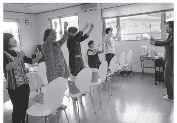
養成講座での2種類の太鼓合奏

誰にでも認知症にはなりたくないという思いや不安はあると思います。一人でも多くの方に日々の暮らしの中に「明るく楽しく過ごすことができるように、これから仲間とともにゲームを楽しく展開していきたい」と想います。