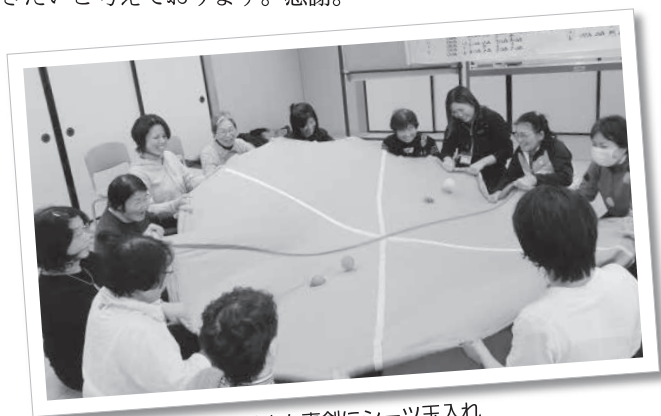
受講生も真剣にシーツ玉入れ

これからもわたしたちには新たな出会いがあるでしょう。その繋がりや絆を大切に、自分の人生も明るく頭を使い、あきらめないで多くの方々にスリーAをお伝えしていきたいと考えております。感謝。