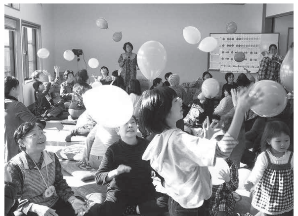
4つのグループが賑やかに風船パレー!

ところが、「いも煮会」当日は、5歳の男の子もいっしょに参加してくれたので、彼に丁寧に手ほどきするかのようにかこつけて、進めて行ったら、誰もが優しいまなざしで彼をほめますように見つめながら行えたので、心配して居たようなムツと感はありませんでした。