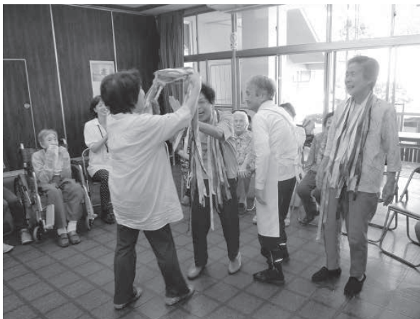
実習でのじゃんけんゲーム

養成講座という種まきをしたことで、このような団体が芽吹き、本当に喜んでいきます。今後、住民自身の活動で、自分の住んでいる地域の高齢者に笑顔の花をたくさん咲かせてもらえようという期待しています。