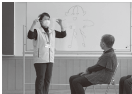
【写真】 昨年度の松阪市第三地域包括支援センター主催の養成講座の一場面